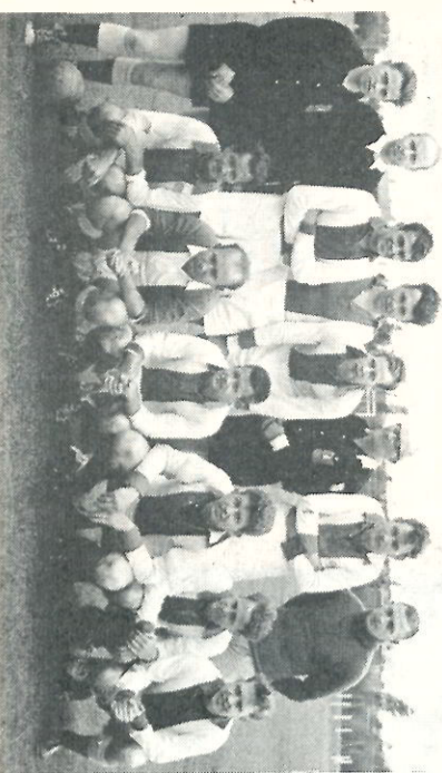
Het Utrechtse elftal, dat met goed voetbal beslag legde op de wisselbeker.